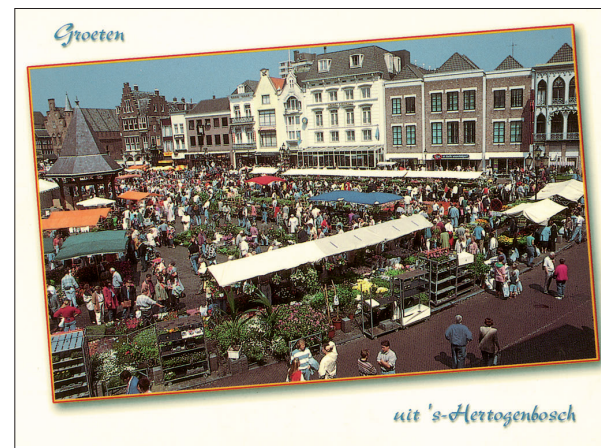
Wordt er anno 2000 nog dialect gesproken tussen de geraniums?

niet meer te horen is. 5 Ook Van den Berselaar 6 is van mening dat het persoonlijk voornaamwoord van de tweede persoon sterk verstoort zit in persoonsvormen als hedde , madde en witte ( heb-je , mag-je en weet-je ).