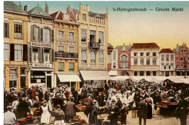
Spaanse invloeden – een Bodega – en veel dialecten op de markt, ca. 1930.

Hoe is nu dat raadselachtige -de achter de persoonsvorm in zin (1) en (2) het beste te vertalen? Weijnen neemt aan dat -de is ontstaan doordat ge is opgegaan in de t-uitgang van het werkwoord. 3 Ondersteuning voor deze aanname vond ik bij Van Gestel e.a. 4 Zij analyseren de Middelnederlandse vorm van wilten wildi als een versmelting van de persoonsvorm wildet (wilt) met het persoonlijk voornaamwoord van de tweede persoon meervoud ghi (gij) . Daarom lijken de Bossche zinnen (1) en (2) het resultaat van achtereenvolgens twee taalkundige verschijnselen: clitisatie (hechting) gevolgd door versmelting, waardoor het persoonlijk voornaamwoord zo in het werkwoord opgaat, dat het met het blote oor